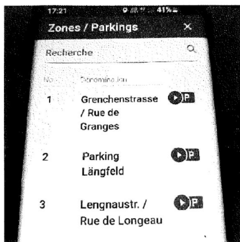
Exemple ville de Bienne